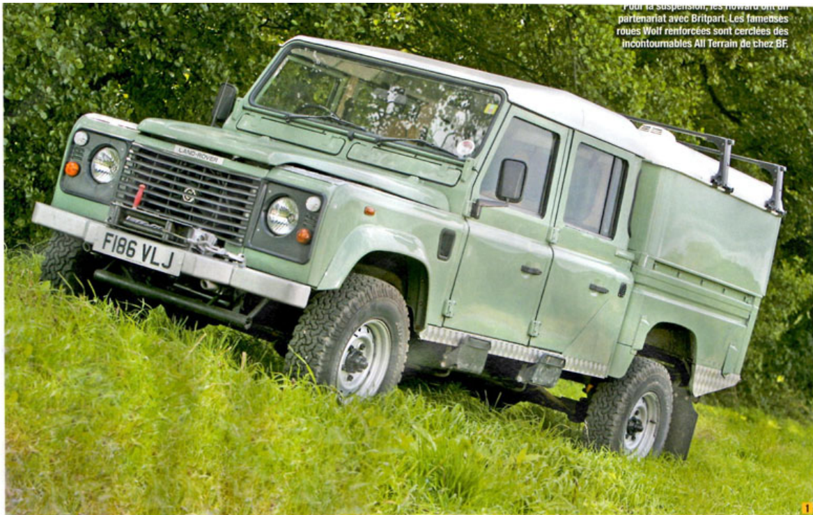
Pour la suspension, les Howard ont un partenariat avec Britpart. Les fameuses roues Wolf renforcées sont créées des incontournables All Terrain de chez BF.

Même si les frères Howard affirment garder volontairement une distance nécessaire avec leur clientèle, de toute évidence, l'ambiance ici n'a rien à voir avec celle d'une concession ou d'un garage traditionnel, surtout quand les clients finissent par appeler les membres de l'équipe par leur prénom. Cela explique aussi les dizaines de photos et courriers de clients expédiés de l'autre bout du monde, au volant de leurs Defender ou même de leurs Serie passés par le garage.